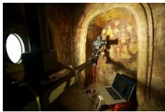
ถ่ายรูปต้นฉบับจริง