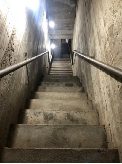
บันไดทางเดินลงไปกรุชั้นที่ 2 ซึ่งปัจจุบันได้ถูกปิด ไม่สามารถเข้าชมได้