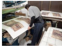
กระบวนการทำแม่พิมพ์