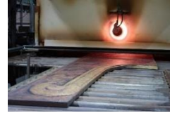
กระบวนการเผา

CERAMICA IMAGE CO., LTD. 3656/41 Green Tower, 14th Floor, Rama IV Road, Khlong Tan, Khlong Toei, Bangkok 10110 Thailand