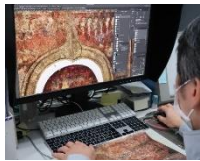
กระบวนการแยกสี